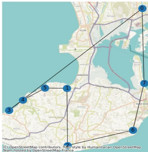
Gambar 2. Rute Distribusi Dengan Nearest Neighbor

Penentuan rute tercepat dan menyelesaikan masalah Travelling Salesman Problem (TSP) untuk kegiatan distribusi pembersih kolam CV MD dapat dioptimalkan menggunakan metode Nearest Neighbor (NN) dengan bantuan software Google Collab. Penentuan dilakukan dengan mencari urutan rute baru yang akan ditempuh oleh supir distribusi dan mempercepat waktu distribusi dengan hasil seperti gambar 2 berikut.